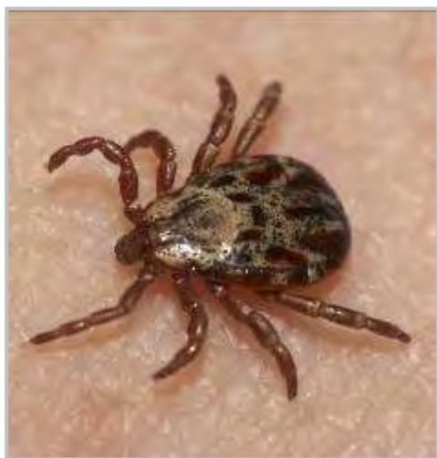
Луговой клещ рода Dermacentor

В северной подзоне области, на территории Александровского, Верхнекетского, Каргасокского районов и г. Стрежевого, где ежегодно происходит 200-300 случаев присасывания клещей, наблюдается sporadическая заболеваемость КИ (1-3 случая в год). В средней подзоне, в Бакчарском, Колпашевском, Кривошеинском, Молчановском, Парабельском, Первомайском, Тегульдетском и Чаинском районах, а также в г. Кедровый за год регистрируется от 2 500 до 3 000 случаев присасывания клещей и наблюдается низкий уровень заболеваемости КИ (2-6 случаев в год). В южной подзоне, в Асиновском, Кожевниковском, Томском и Шегарском районах риск заражения КИ наиболее высок. На долю этих районов приходится от 70 до 86 % случаев присасывания клещей и заражений инфекциями.