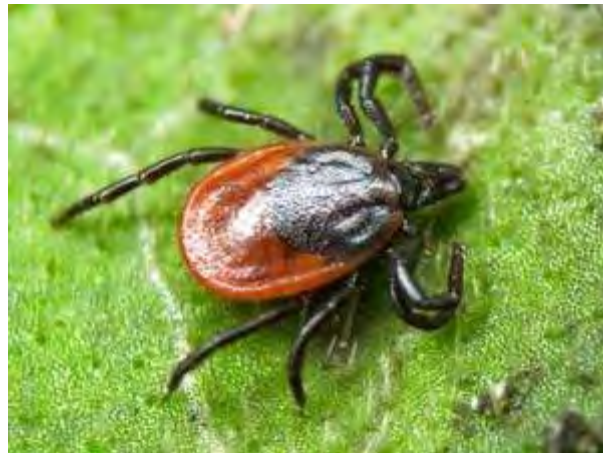
Таежный клещ рода Ixodes

На сегодняшний день клещевые инфекции стали проблемой крупных населенных пунктов. В Томской области это касается, прежде всего, территории г. Томска и его рекреационной зоны, где обитает два плохо отличимых друг от друга вида иксодовых клещей (Ixodes): таежный и клещ Павловского. В последние годы возросла численность ещё один клеща – лугового, принадлежащего к роду Dermacentor, который имеет два пика активности – весенний (май-июнь) и осенний (август-сентябрь). Ввиду экологических особенностей клещей и различий в их биологии случаи присасывания наблюдаются в несвойственных ранее местах – в парках, на придомовой территории, на спортивных и детских площадках и т.п.